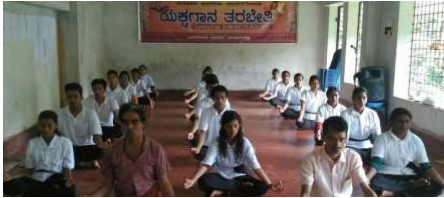
Morning Session Yoga