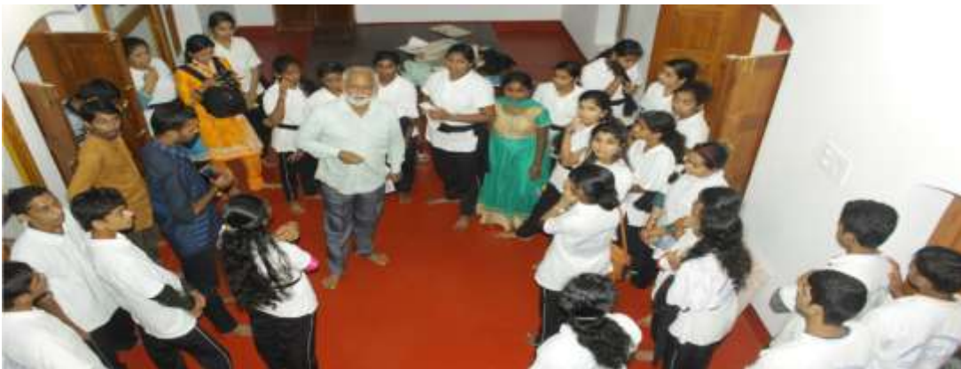
Gilivindu – Manjeshwara