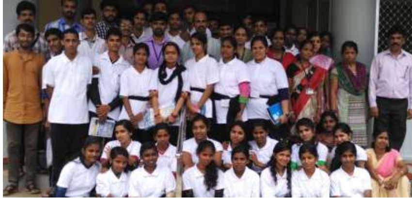
@ MGM College Udupi