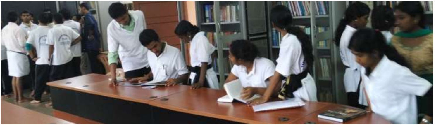
Yakshagana Library – Yakshagana Study Centre Mangalore University