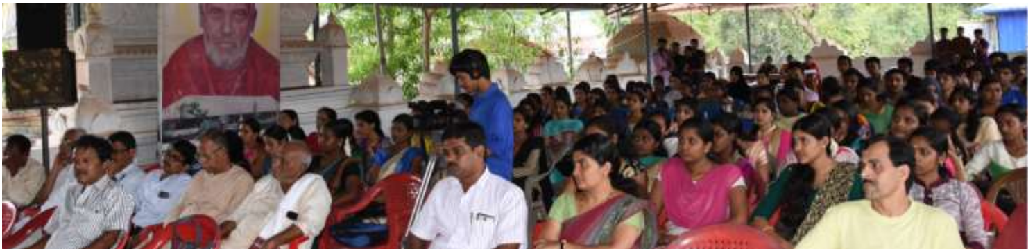
Audience – Inauguration Ceremony