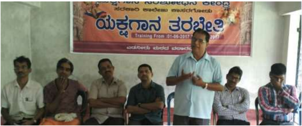
Naa. Karanta Peraje