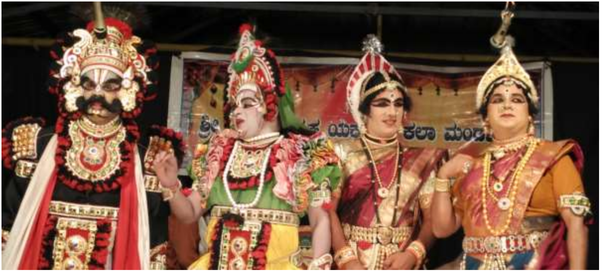
Yakshagana performance by Edaneer Mela. Participants