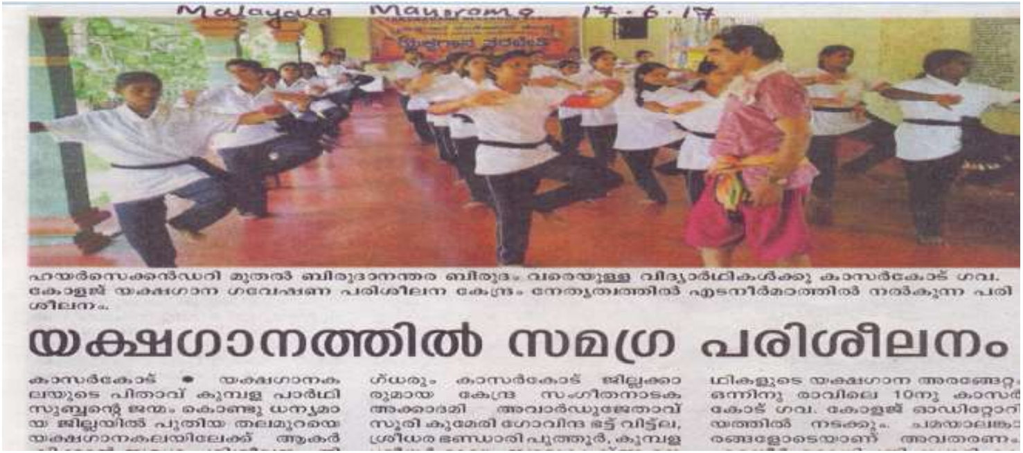
Malayala Manorama 17.06.2017