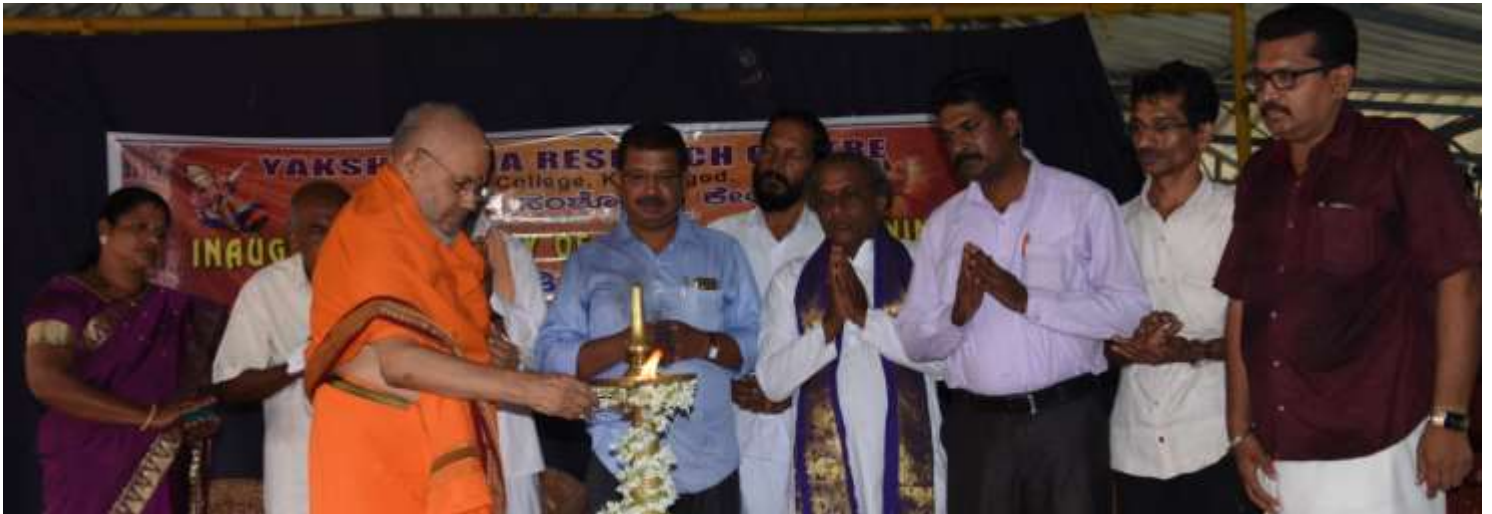
Inauguration By Sri Sri Keshavananda Bharathi Swamiji, Edaneer Mutt