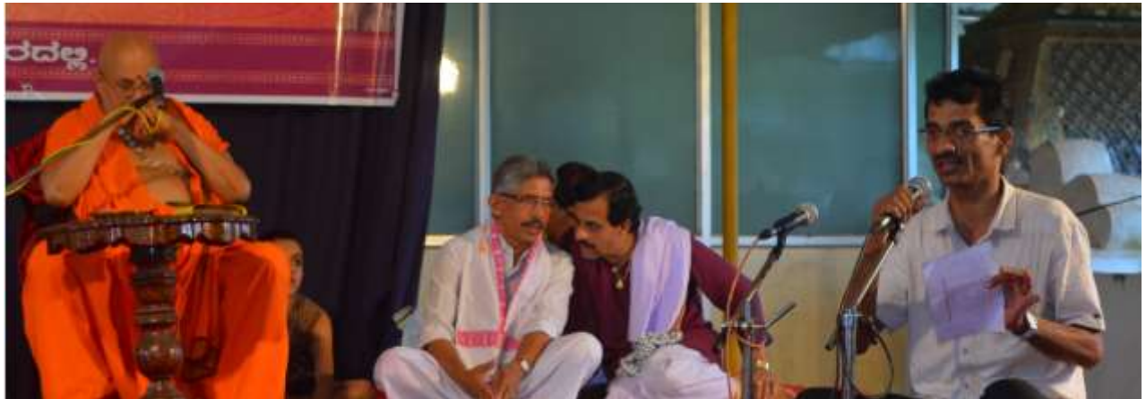
Discussion with Swamiji