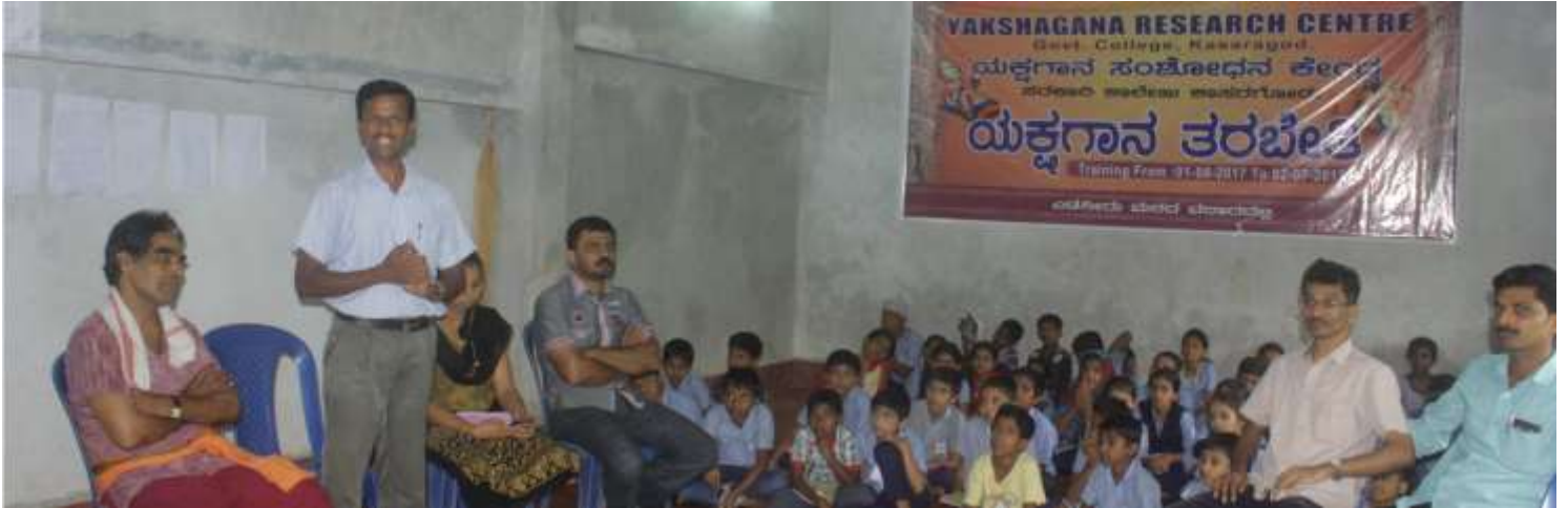
Various School teachers and students visited the camp