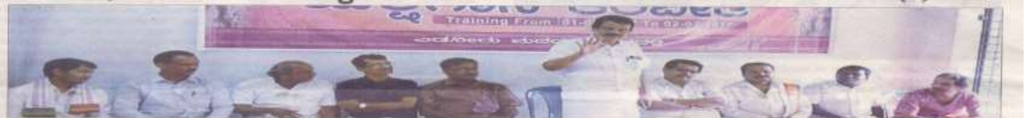
ಪರವರ್ತಿ, ಕಾರ್ಯದರ್ಶಿ, ಭಾವಾಭಿನಯದ ಪ್ರಾಧಿಕಾರಿಗಳು.