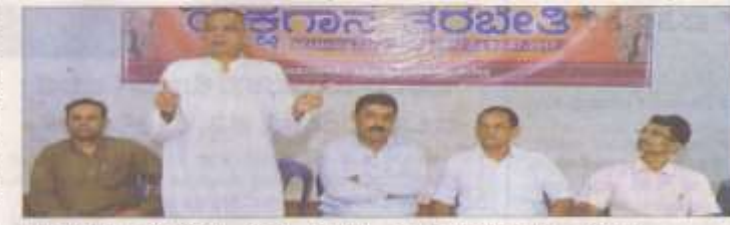
ಪರವರ್ತಿ, ಕಾರ್ಯದರ್ಶಿ, ಭಾವಾಭಿನಯದ ಪ್ರಾಧಿಕಾರಿಗಳು.

ಕುಬಣೂರು, ಜೂನ್ 24: ಕಲೆಯು ಬೆಳೆದಾಗಲೇಯೇ ಪತ್ರಿಕೆ ಕಲಾವಿದರನ್ನು ಕಲಾ ಮಹೋದಯ ಸೃಷ್ಟಿಸುತ್ತದೆ. ಪತ್ರಿಕೆಯು ಕಲೆಯನ್ನು ಕಲೆಯಂತೆ ಕಾಣಿಸಿ ಯಕ್ಷಗಾನದ ನಡೆ ಪರಿಪೂರ್ಣತೆ ಕಡೆ ಕಾರ್ಯಕ್ರಮವು ನಡೆಯಿತು.