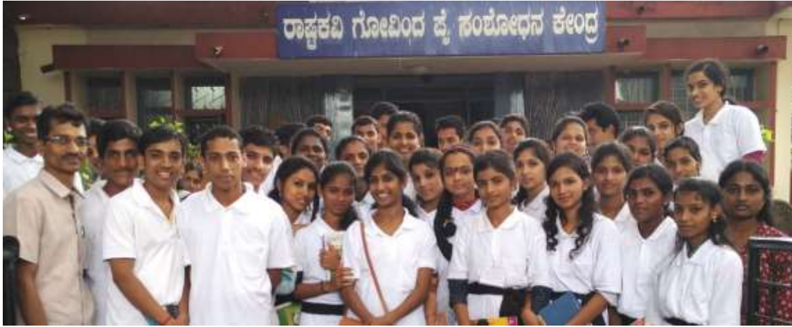
Govinda Pai Research Centre Udupi