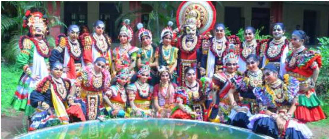
Camp Participants in Rangapravesham