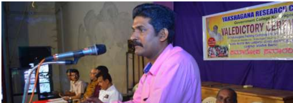
Hon. Principal In charge